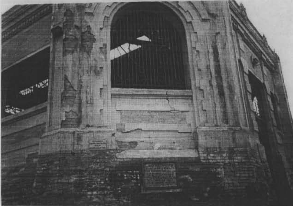
Fotografía No. 1. Plaza Las Cruces. Se observa el deterioro generalizado de los muros de la plaza.

DIRECCION DE PREVENCION Y ATENCION DE EMERGENCIAS