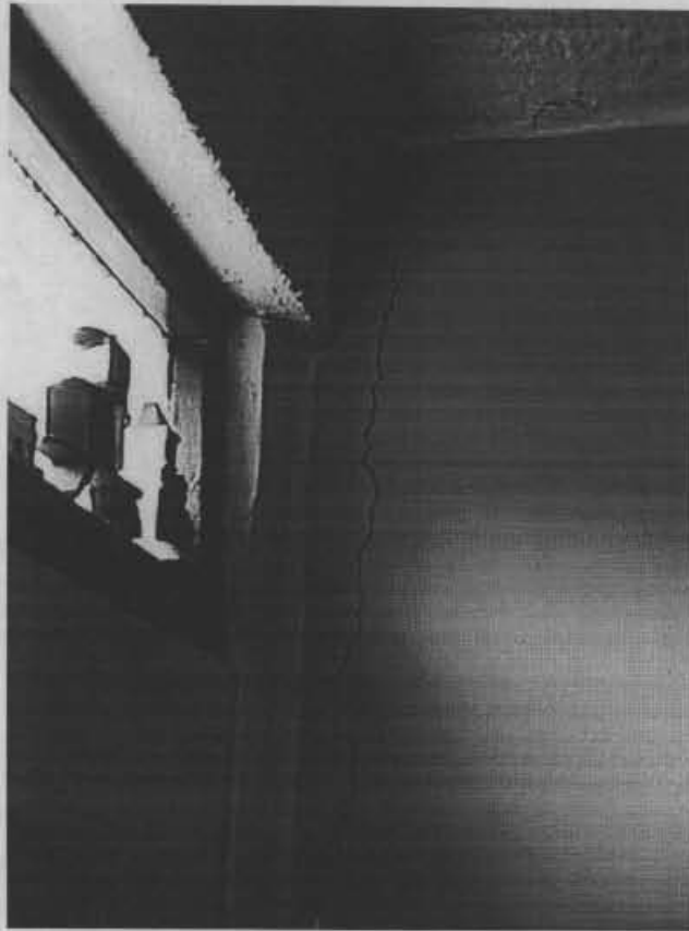
Fotografía No. 3. Grieta vertical en la esquina suroccidental del apartamento No. 301 perteneciente al bloque 15.

DIRECCION DE PREVENCION Y ATENCION DE EMERGENCIAS