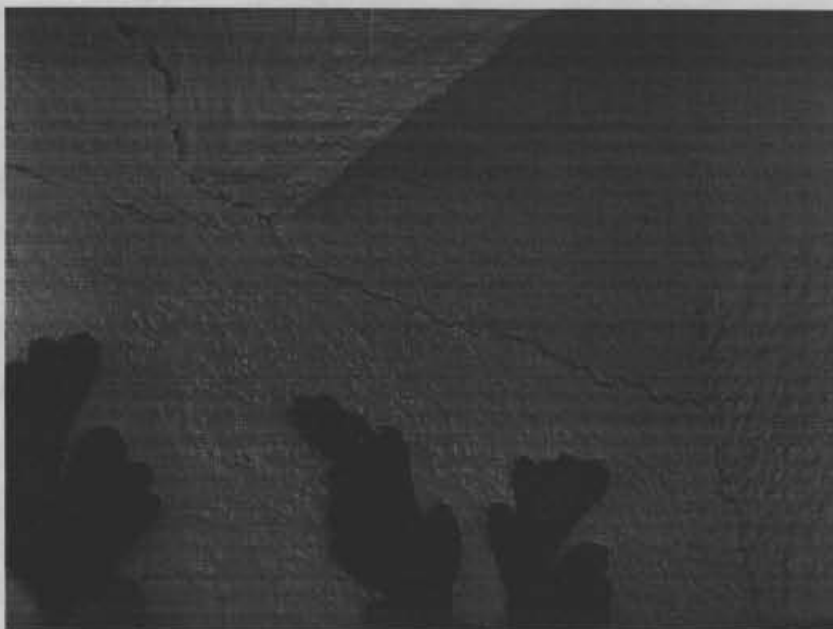
Fotografía No. 4. Grietas entre la parte superior del muro del tercer piso del bloque 15 y las viguetas que conforman la losa del siguiente piso.