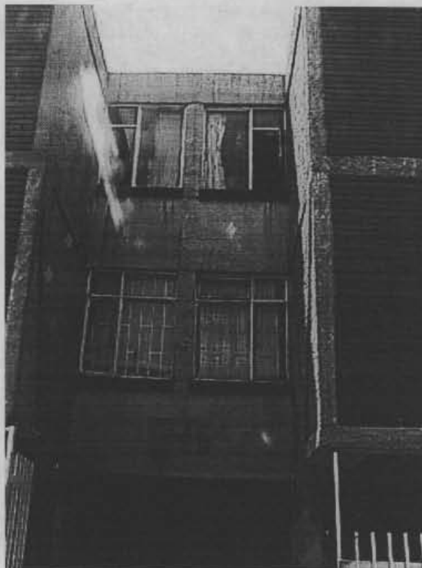
Fotografía No. 1. Panorámica del bloque 15. Se alcanza a observar la inclinación del edificio, debido a que los bloques 14 y 16 se apoyaron sobre éste, presentándose grietas en algunos de los apartamentos de la edificación.

DIRECCION DE PREVENCION Y ATENCION DE EMERGENCIAS