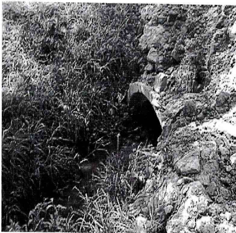
Fotografía 2. Paso del canal por vía perimetral del barrio. Se observa la cantidad de sedimentos y la poca capacidad de flujo de la tubería.