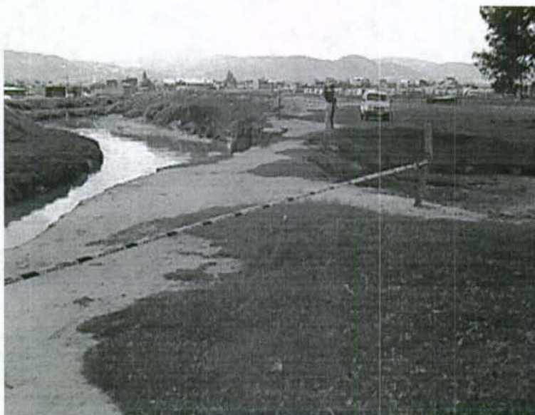
Foto 4. Vista hacia aguas arriba del jarillón izquierdo sobre el río Tunjuelo a la altura del barrio La Esmeralda.