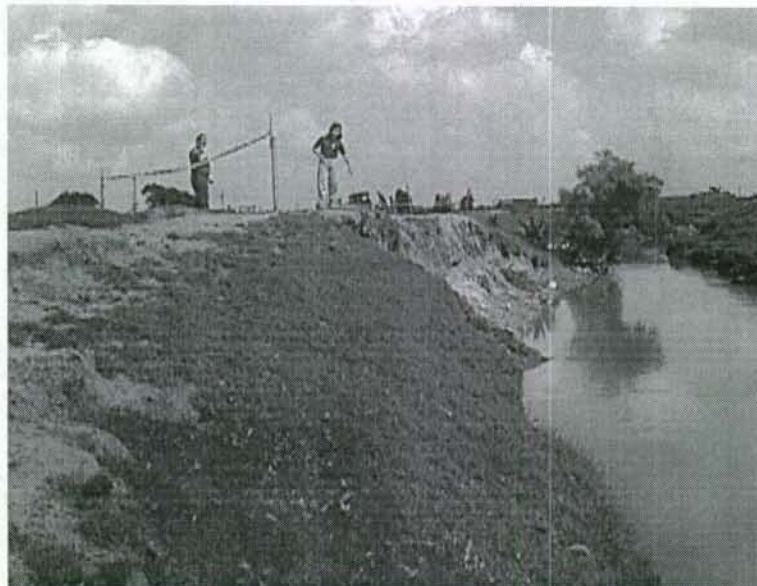
Foto 2. Vista hacia aguas abajo del jarillón izquierdo sobre el río Tunjuelo a la altura del barrio La Esmeralda. Se aprecia la altura y el deslizamiento que se presentó en el jarillón.