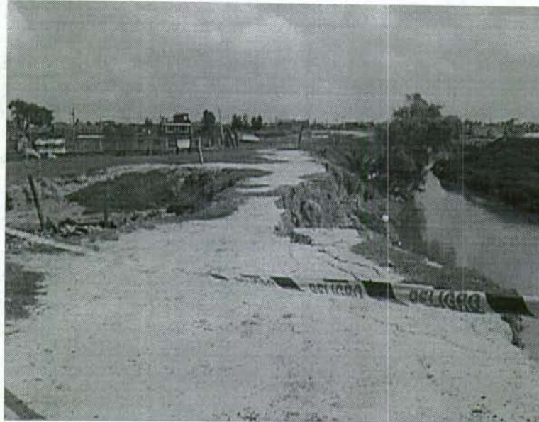
Foto 1. Jarillón izquierdo sobre el río Tunjuelo a la altura del barrio La Esmeralda. Nótese la zona de líneas de falla que van paralelas al cauce y la estrecha corona del dique. Hacia la izquierda de la foto se aprecia el sitio donde estaba ubicada una vivienda que posteriormente fue demolida por los ocupantes de la misma.