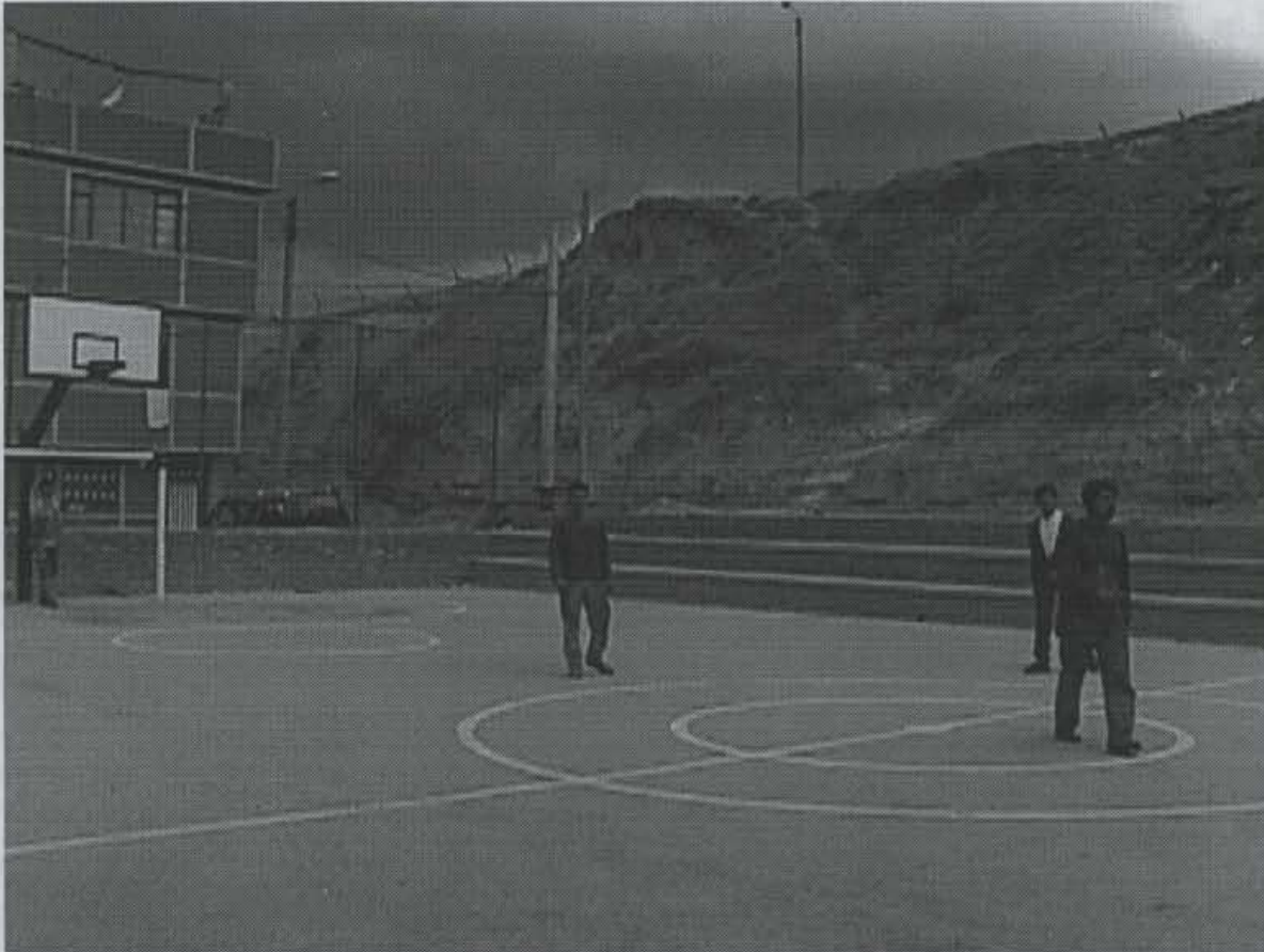
Fotografía No. 3. Tramo restante del talud adyacente a la cancha polideportiva del barrio San Juanito. Se observan evidencias de pequeños desgarres locales del material más superficial hacia el centro – superior de la fotografía.