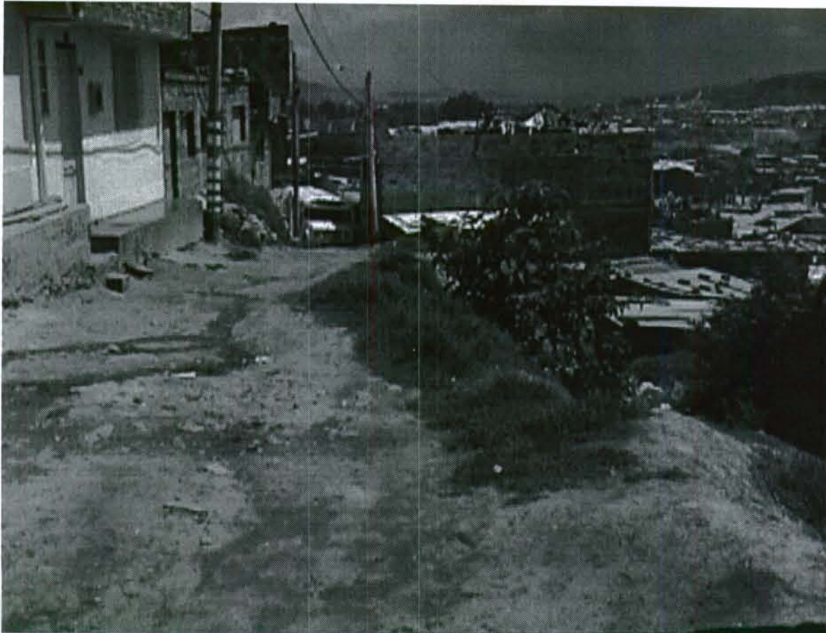
Fotografía No. 2. Diagonal 49 D Sur, la cual corresponde a la parte superior del talud que debe protegerse con la construcción de un muro de contención.