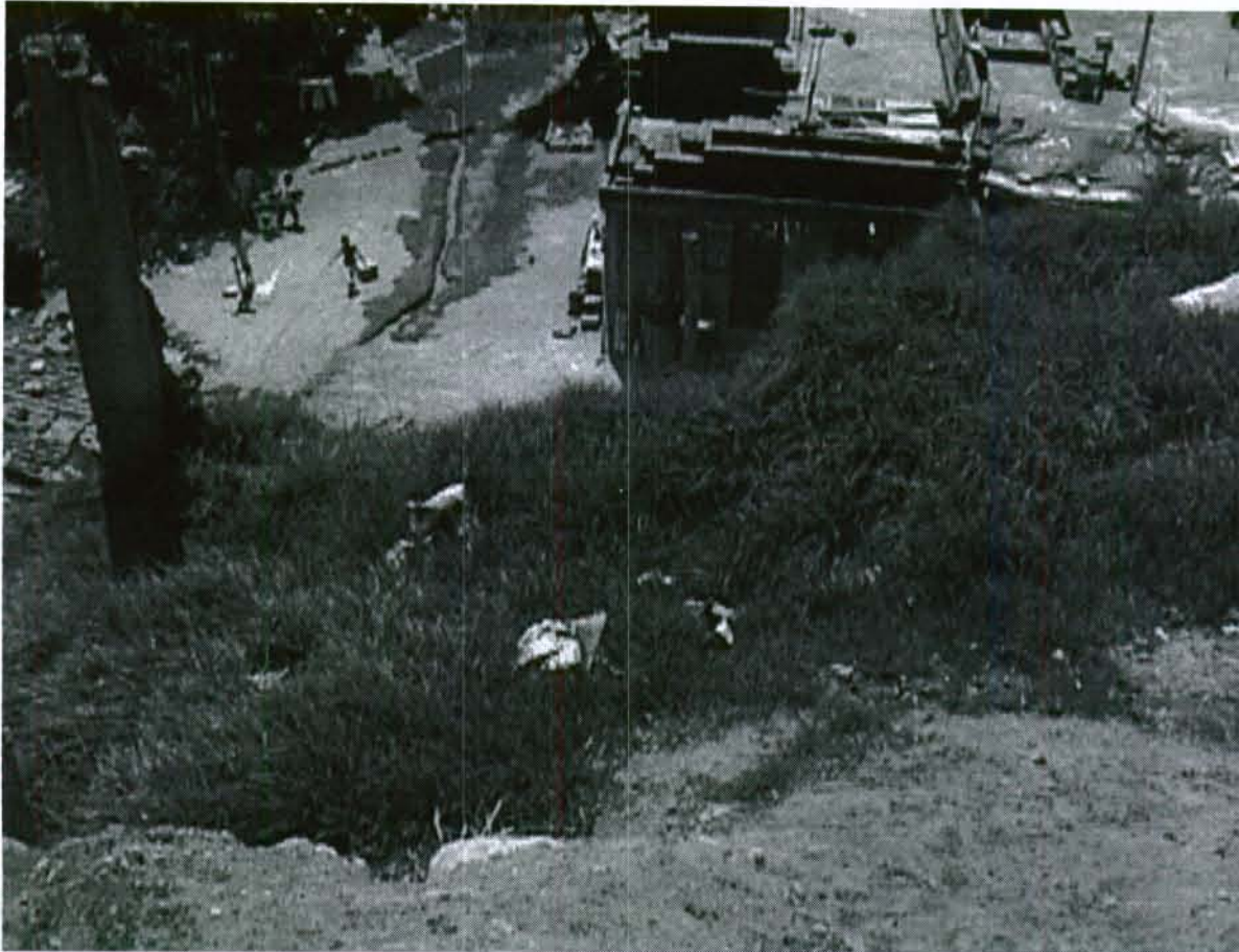
Fotografía No. 3. Detalle de un tramo del talud, en el cual se evidencia la pendiente considerable de esta ladera.