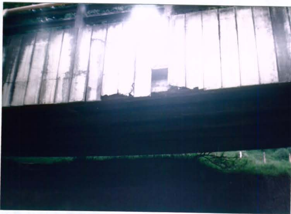
FOTO No. 3 : Detalle de las losas que presentan desprendimientos de bloques.