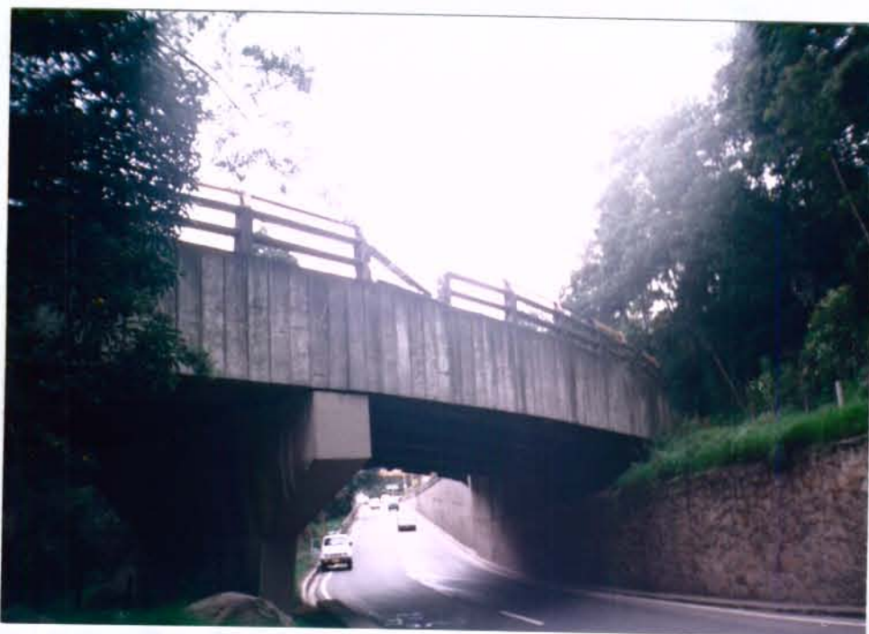
FOTO No. 4 : Baranda en concreto destruida y que presenta amenaza de caída de bloques al flujo vehicular inferior.