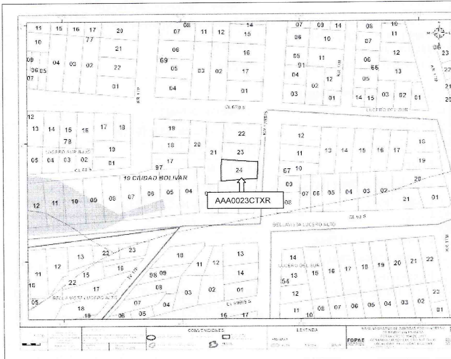
Figura 1. Localización General del Proyecto ubicado en la Kra 17 N BIS No 67 B 19 SUR, en el Plano Normativo de Amenaza por Remoción en Masa del POT (Decreto 364 de 2013).

Beltrán Triana” ubicado en la Kra 17 N BIS No 67 B 19 SUR del barrio Monte Blanco de la Localidad de Usme, se encuentra en una zona de AMENAZA MEDIA por procesos de remoción en masa (Figura 1).