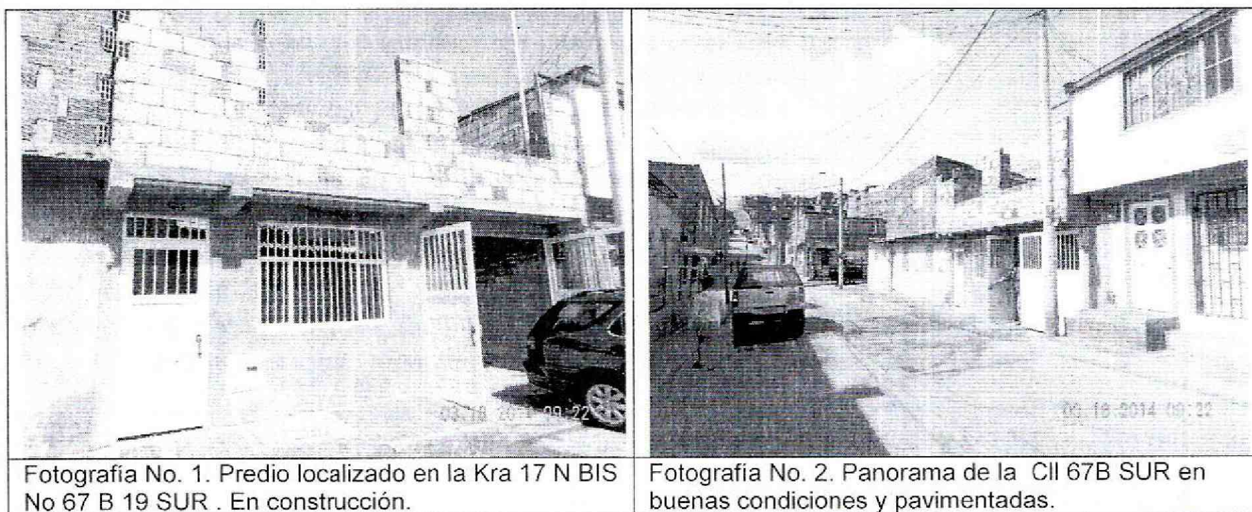
Fotografía No. 1. Predio localizado en la Kra 17 N BIS No 67 B 19 SUR . En construcción.

Tal como se mencionó, en el momento de la verificación de campo adelantada, no se evidenció la presencia de procesos de remoción en masa activos, que involucren el área donde se busca desarrollar el proyecto. Sin embargo se reportan fenómenos de remoción en masa entre los 50-100 metros, tal y como se observa en la Tabla No. 1.