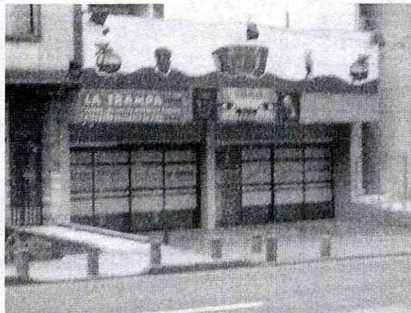
Foto No. 1. Aspecto del predio donde se llevará a cabo el proyecto de la carrera 7 No. 45 - 55

encuentra construida una edificación de un nivel donde actualmente funciona un local, que se encuentra construido sobre un talud de corte y relleno, en el cual, en el momento de la visita, no se observan evidencias de inestabilidad geotécnica, ni de daños que puedan comprometer su habitabilidad bajo cargas normales de servicio.