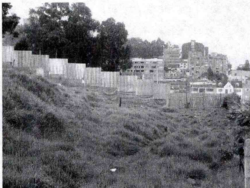
Foto No. 1. Aspecto de los rellenos presentes en la parte sur oriental del predio

De acuerdo con la inspección realizada, superficialmente el lote donde se implantará el proyecto, presenta algunas zonas con rellenos antrópicos dispuestos localmente y cuyo espesor se desconoce; la presencia de tales rellenos se ubica principalmente en el costado sur oriental del predio (Foto No. 1); de acuerdo con la disposición de los mismos, posiblemente, los rellenos provienen de las intervenciones realizadas para adecuar la vía ubicada en la parte alta del predio y que corresponde a la Carrera 2.