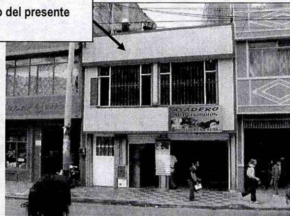
Fotografía No.1. Vista externa del predio localizado en la Carrera 3 No. 48X-19 Sur