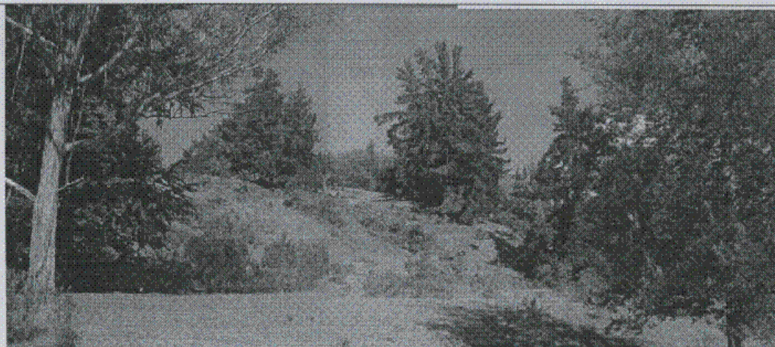
Fotografía 1. Vista hacia el sur-este. Al centro de la fotografía, se observan evidencias de suelos superficiales en proceso de reptamiento en ladera de pendiente media