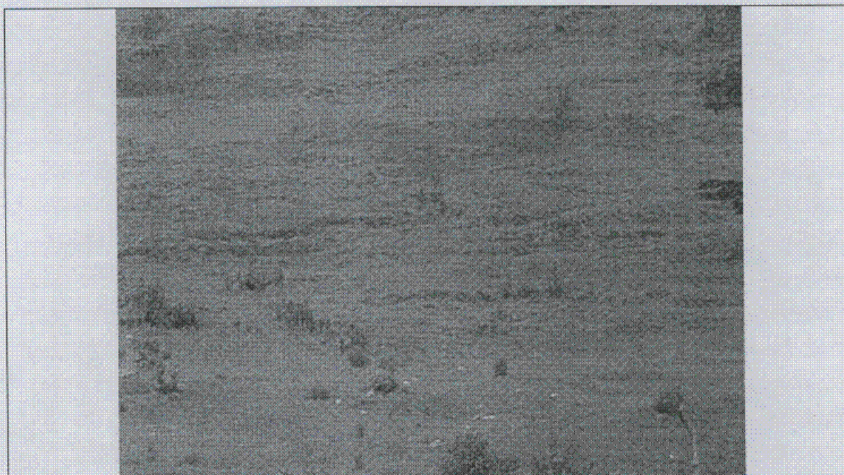
Fotografía 2. Detalle de la expresión superficial del proceso de reptamiento, con sectores de pérdida de continuidad y sectores con acumulación de la deformación