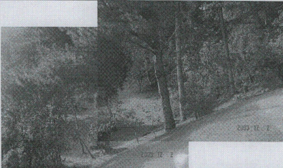
Fotografía 6. Vista hacia el sector sur-oriental del predio, zona de características similares a las indicadas en la fotografía 5. Se observan algunos árboles inclinados asociados con los flujos lentos superficiales del suelo residual.

DIRECCIÓN DE PREVENCIÓN Y ATENCIÓN DE EMERGENCIAS