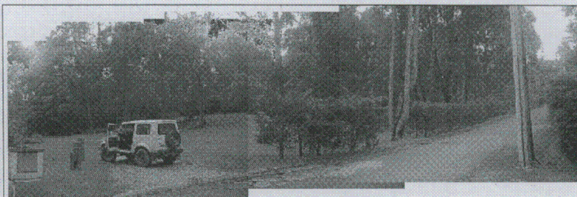
Fotografía 2. Sector central del predio con topografía de pendiente baja a moderada y buenas condiciones de estabilidad.