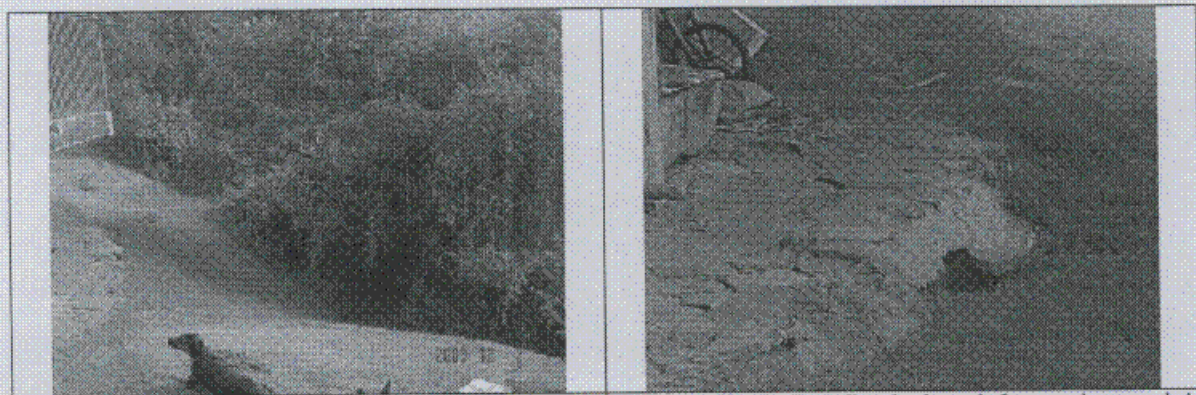
Fotografía 4. Vista del costado sur del predio, correspondiente a la zona de pendiente alta. Se presentan flujos superficiales que han afectado el piso exterior de la casa.