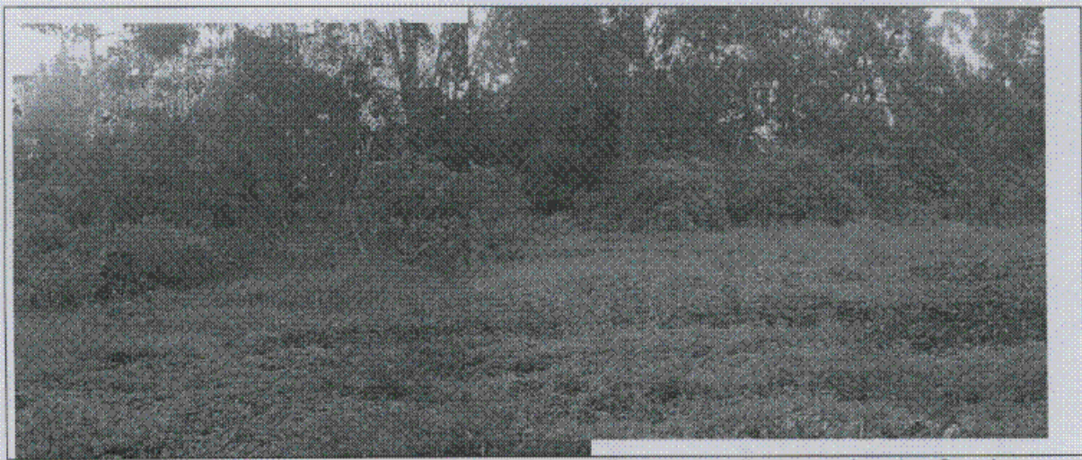
Fotografía 3. Detalle del costado occidental del predio con pendiente moderada. Se observan localmente flujos lentos superficiales de la capa de suelo residual.