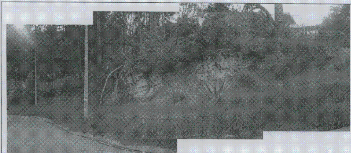
Fotografía 1. Talud de corte costado occidental de la Carrera 83, el cual muestra los niveles superficiales de arcillolita gris del Conjunto Inferior de la Formación Guaduas.

Igualmente el sector sur-oriental, de pendiente alta evidencia fenómenos de reptamiento de suelos superficiales, destacándose la presencia de árboles inclinados (ver fotografía No.6).