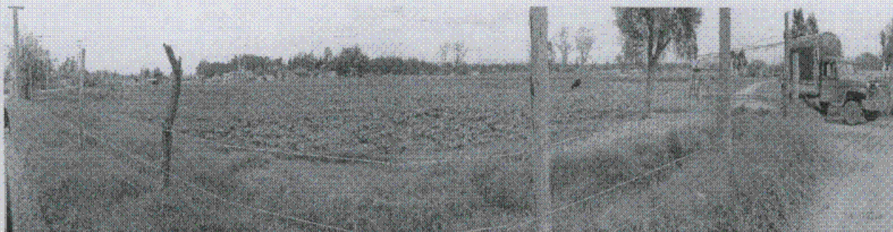
Foto 1. Panorámica de 180° del Predio AGUA BLANCA – EL REMATE, sector sur. La topografía es predominantemente plana. Existe cobertura vegetal compuesta de pastos, algunos sectores del predio se utiliza para cultivar hortalizas. La vía de acceso al predio está por el costado sur y está sin pavimentar.

En inmediaciones al sector se están desarrollando obras de urbanismo, lo cual contribuye a mejorar las condiciones del sector de una manera significativa.