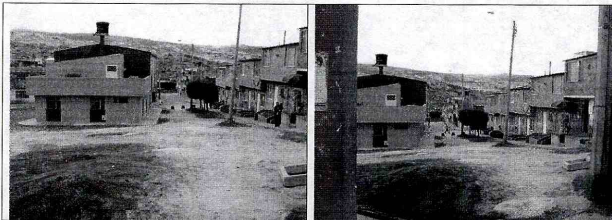
Fotografías No.1. Sector Donde se Proyecta la Construcción de una Vía Peatonal Para el Barrio La Marichuela (Valles de Cafam).

Para el desarrollo del presente concepto no se tuvo conocimiento del tipo o propuesta de intervención de la zona, para la ejecución de las obras proyectadas.