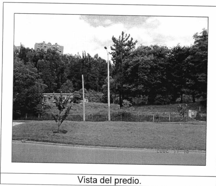
Vista del predio.

El predio se encuentra completamente arborizado y no se observan procesos de remoción en masa actuales.