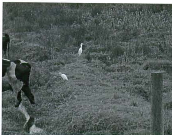
Foto 2. El predio alberga vida silvestre que vive en mutualismo con el ganado que esporádicamente pasta en la zona.