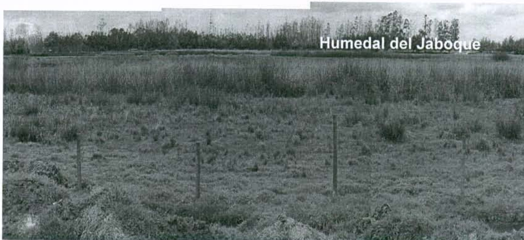
Foto 1. Vista panorámica del predio El Porvenir Engativá. Al fondo se aprecia el Humedal del Jaboque. El predio es una zona pantanosa cubierta de juncos e islas de pasto. Por la depresión del terreno, este retiene agua formando pequeñas lagunas interconectadas entre sí.

El predio está ubicado muy cerca al extremo de la desembocadura de la cuenca del Jaboque donde la altitud de la zona es muy baja con relación al resto de la cuenca. Dichas circunstancias caracterizan a la zona como de Pantano el cual presenta periodos de anegamiento debido a su vecindad al río Bogotá.