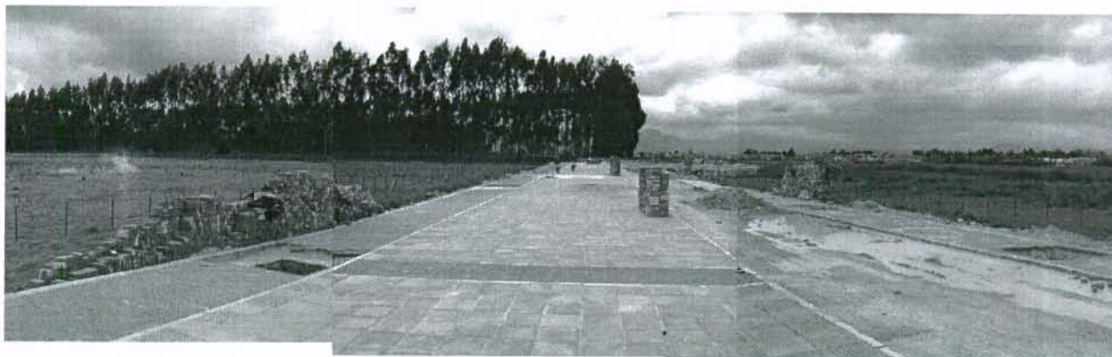
Foto 3. Aledaño al predio se construye una cicloruta que empata con la g existente en la Autopista Medellín. Para la construcción de la cicloruta se realizó un terraplén de aproximadamente 2.5 metros de altura.