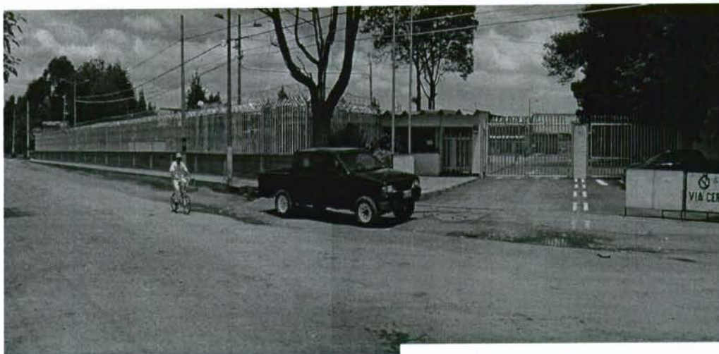
Foto 1. Vista panorámica del predio COLEGIO E.T.B. Anteriormente, las instalaciones de este predio servía para el almacenamiento y mantenimiento de parte de redes telefónicas.

El predio está ubicado al sur de la desembocadura de la cuenca del Jaboque, la altitud del predio con relación al humedal es alta. Dichas circunstancias determinan que el predio se mantenga seco aún en periodos de lluvias.