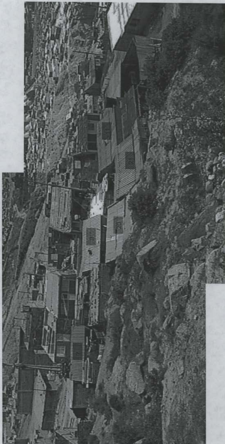
Foto No. 1. Vista de la manzana 7 desde el cuerpo del deslizamiento, al sur de las viviendas. Se observa como el material movilizado se apoya sobre las construcciones existentes en la parte oriental.

Diagonal 47 No. 77B – 09 Interior 11 PBX: 4297414 Fax: 4109036 Santa Fe de Bogotá, D.C.