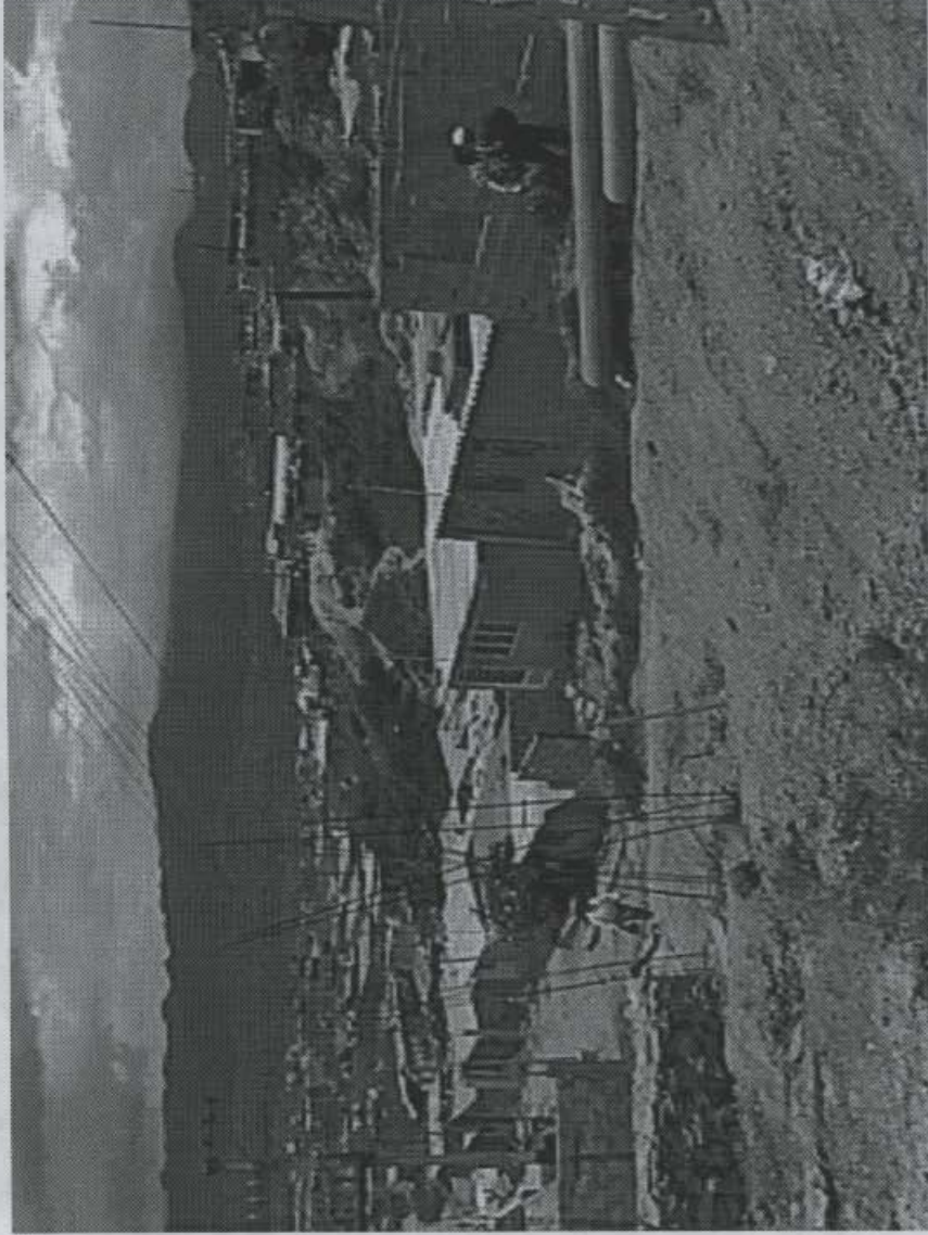
Foto No. 3. Vista del costado norte de la manzana 7. Se aprecia la calidad de las construcciones. Por esta calle se conducen las aguas servidas hasta un pozo localizado en la parte inferior, frente a la manzana 3.

DIRECCION DE PREVENCIÓN Y ATENCIÓN DE EMERGENCIAS