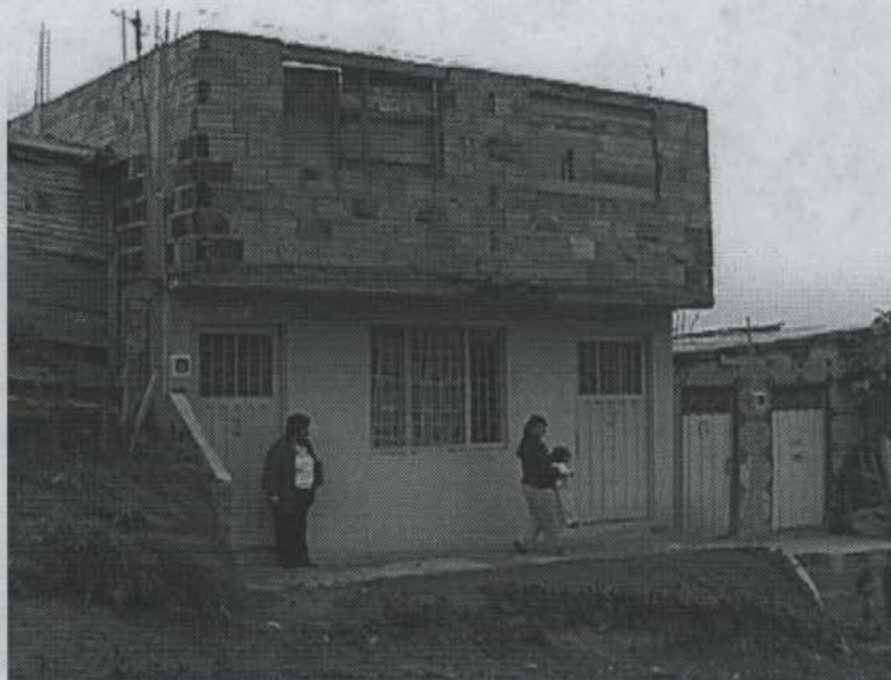
FOTOGRAFIA No. 3

Sobre la transversal 18 Q Bis con 69 B, se observan dos viviendas en buen estado en su fachada, sin embargo se ven afectadas interiormente presentando grietas y hundimientos del terreno sumado a problemas de humedad continuos (ver Fotografía No. 3 ).